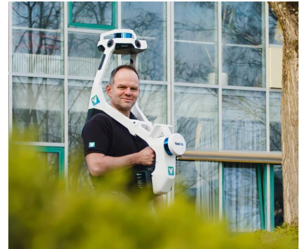
Wie werden Immobilien digital – und wozu?“ Impuls und Live-Präsentation mit vreed