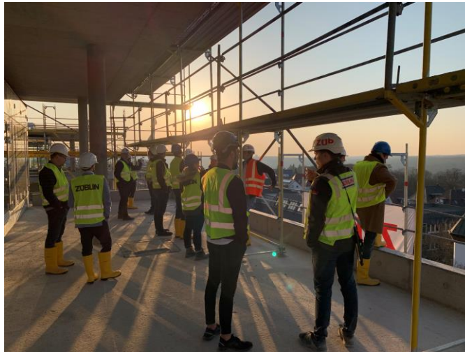
Projektexkursion DOC Degerloch Office Center